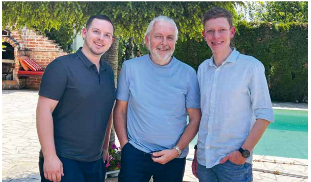
Leads sind Chancen die genutzt werden müssen.

Beispielrechnung auf Basis branchenüblicher Benchmarks (HBR-Studie zur Reaktionszeit, 2011). Konkrete Werte variieren je nach Branche und Angebot.