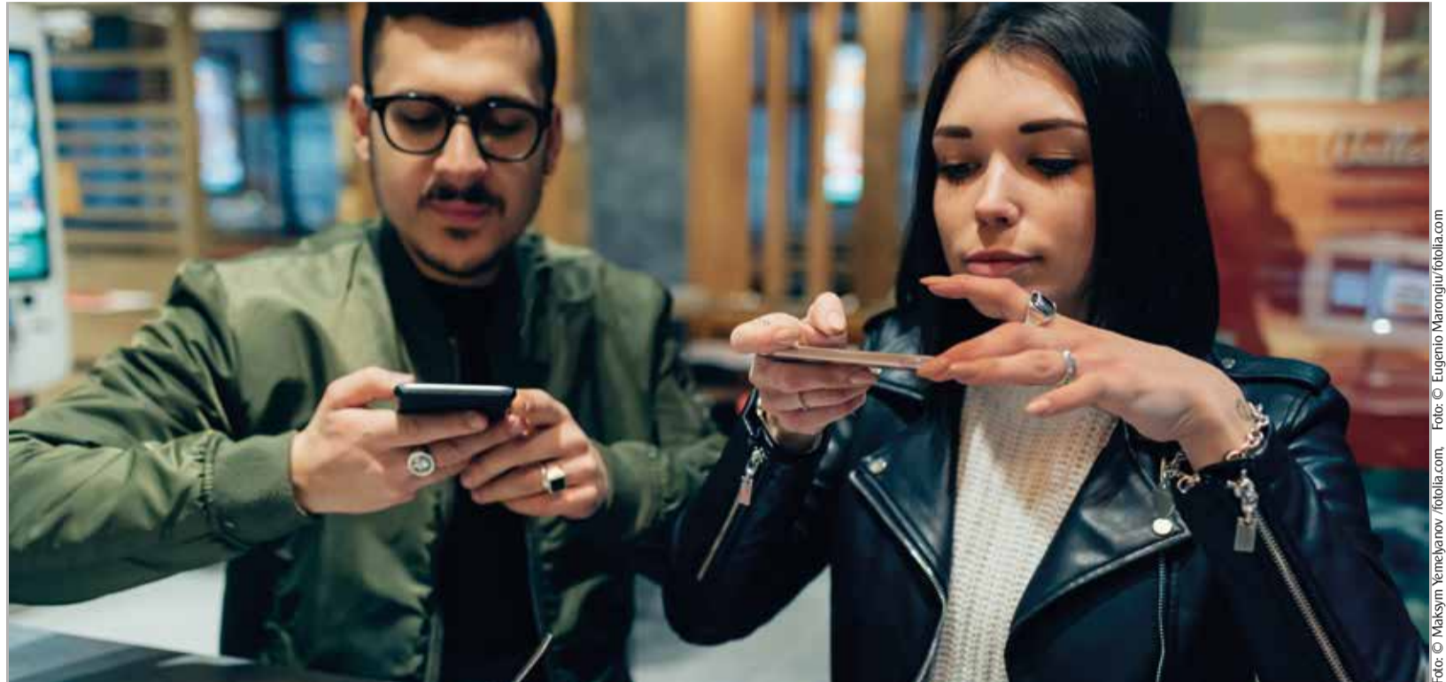
Wer Follower gewinnen will, muss ihnen einen tiefen Einblick in den eigenen Alltag verschaffen.

Kontrolle ist besser. Auf Instagram wird das Posieren mit einem Produkt mit bis zu 500.000 US-Dollar pro Post vergütet. Dass diese stattliche Summe nicht nur Idealisten anzieht, ist kaum verwunderlich. So werben immer mehr Instagrammer mit hohem Engagement und