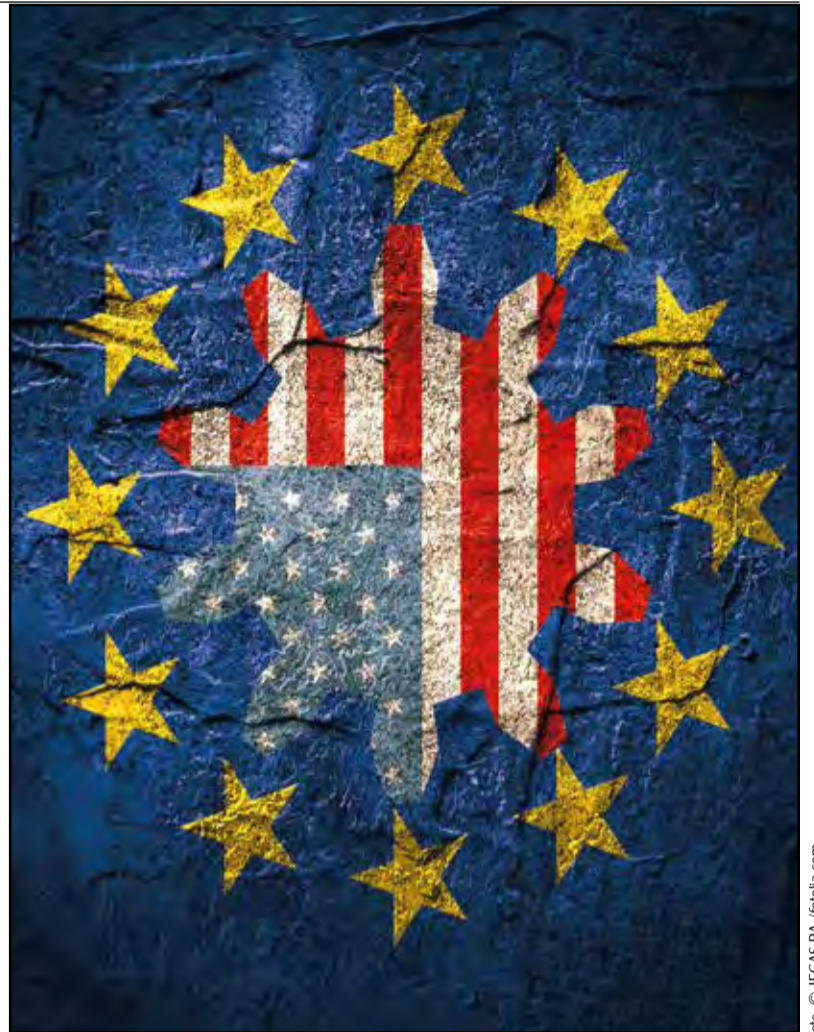
Die Datenschutz-Grundverordnung hat in einer globalisierten Welt nicht nur Auswirkung auf Marketer in europäischen Ländern - auch die USA sind betroffen.

Deadline verfehlt! Die meisten Befragten der IAPP-Umfrage sind zuversichtlich, dass sie bis 25. Mai auf die DSGVO vorbereitet sein werden. Aber nicht alle: 9 Prozent (USA)