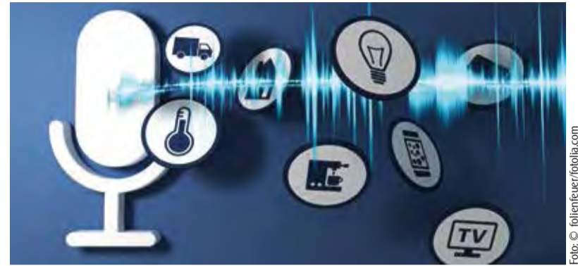
Sprachassistenten eröffnen neue Nutzungshorizonte für Radiosender.